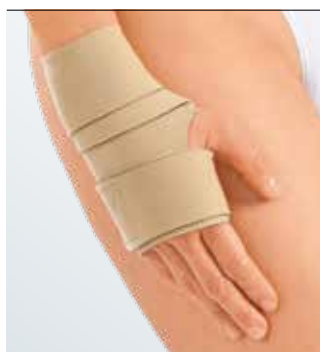
circaid juxtafit essentials hand wrap