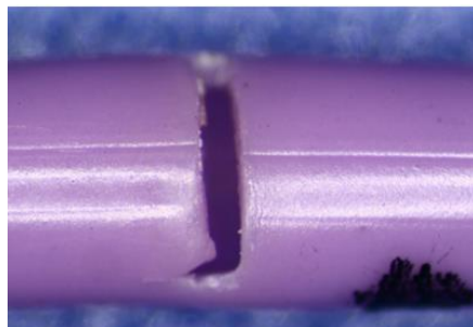
Figur 1: Exempel på tvärgående/perifer spricka i kateterkroppen

BD har identifierat ytterligare två bidragande faktorer till ökningen av materialutmattningen och läckaget som ses på 4Fr Single Lumen PowerPICC i vissa geografiska områden. Varje faktor måste kontrolleras för att minimera felen.