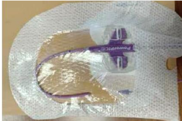
Figur 3: Bild av J-loopen