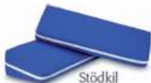
Stödkil Curera® Stödkil inkl. Hygienskydd 70x26x15/5 cm