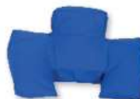
Abduktionskudde Curera® Abduktionskudde 35x55 cm & 54x78 cm