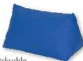
Trekantskudde Curera® Trekantskudde 47x28x28 cm & 62x35x35 cm