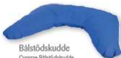
Bålstöds-kudde Curera® Bålstöds-kudde 85x65x30 cm