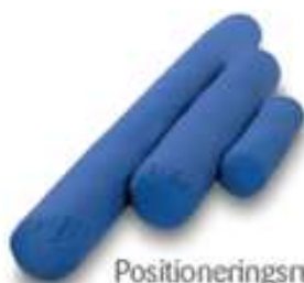
Positioneringsrulle Curera® Positioneringsrulle 15x60 cm, 20x125 cm & 20x225 cm