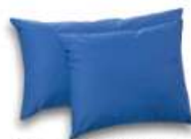
Positioneringskudde Curera® Positioneringskudde 40x70 cm, 50x60 cm, 50x85 cm & 50x100 cm