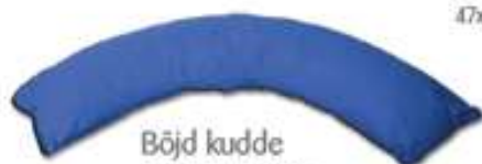
Böjd kudde Curera® Böjd kudde 120x75x30 cm, 110x75x40 cm & 75x40x25 cm