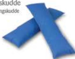
Positioneringskudde Curera® Positioneringskudde 25x80 cm