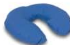
Nackkudde Curera® Nackkudde 32 cm, 38 cm & 50 cm