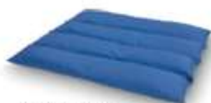
Multikudde Curera® Multikudde 45x45 cm & 60x70 cm