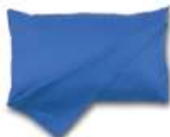
Ryggstöds-kudde Curera® Ryggstöds-kudde 50x85 cm