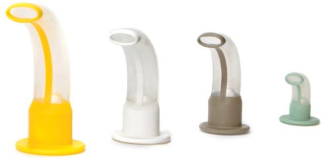
ISO storlek 9.0

Varje avdelning behöver bestämma lokalt hur denna förändring ska genomföras, eftersom en utfasningsperiod av befintliga lagermängder kommer att ta vid.