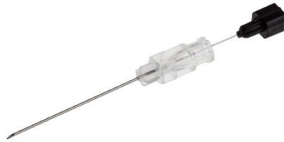
Ordinarie produkt BD ref 405254 – BD™ Quincke Spinalkanyl, 22G x 38 mm

BD™ Quincke Spinalnål, 22G x 64 mm, svart Artikelnummer: 405244 (VF: Ej upphandlad)