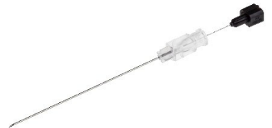
Ersättare BD ref 405244 – BD™ Quincke Spinalkanyl, 22G x 64 mm