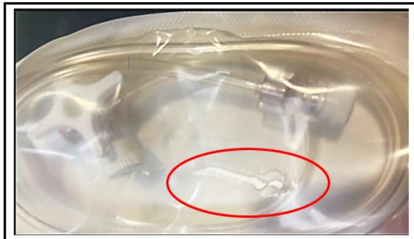
Figur 2: Bristning i blisterförpackningen