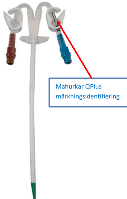
13,5 Fr böjd förlängning

<Bilderna kan användas baserat på område>